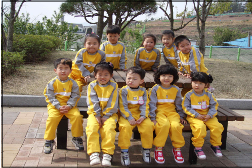
<뮤지컬관람을 하고 나서>