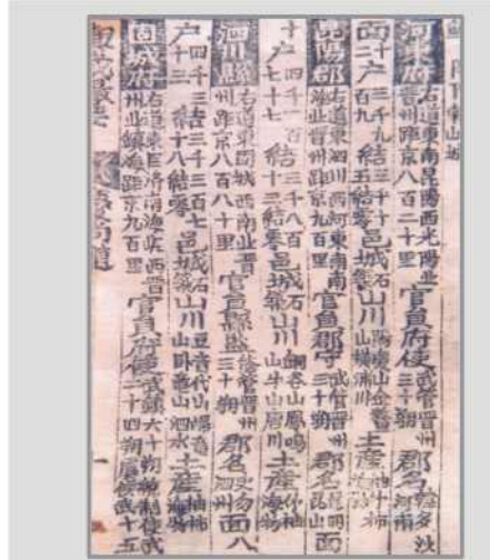
여재촬요의 지리서에 의하면 사천 현은 우도 동고성 서남북 진주 서울까지의 거리가 880리 관원현감이 근무, 군명은 사물 또는 사주라고 함.