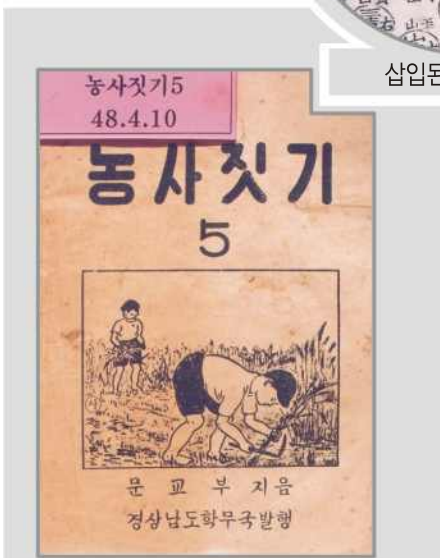
경상남도교육청 발행 최초의 재량활동 교재