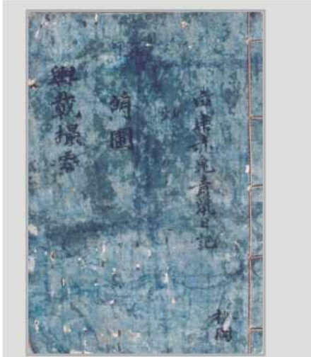
輿載撮要(여재촬요) :1800년대 후반의 지리서 내용 : 세계의 대륙별 각국의 개략과 조선 八道の 道程途標와 지도 및 地方의 自然 人文환경과 특산물이 기록되어 있음.