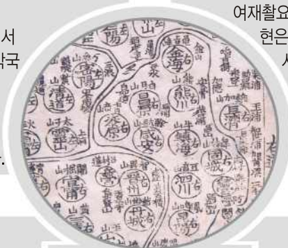
삽입된 지도의 일부